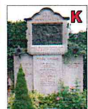
16 Grabmale des Kreuzweges